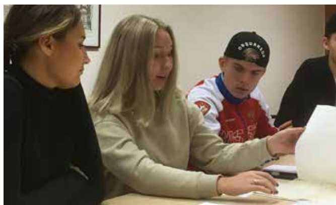
Elever från Slottegymnasiet i Ljusdal med arbetsuppgifter.