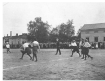
Fotbollsmatch på Kotorget i Hudiksvall, ca 1920.