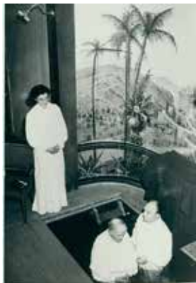
Baptistdop i Hudiksvall 1948.