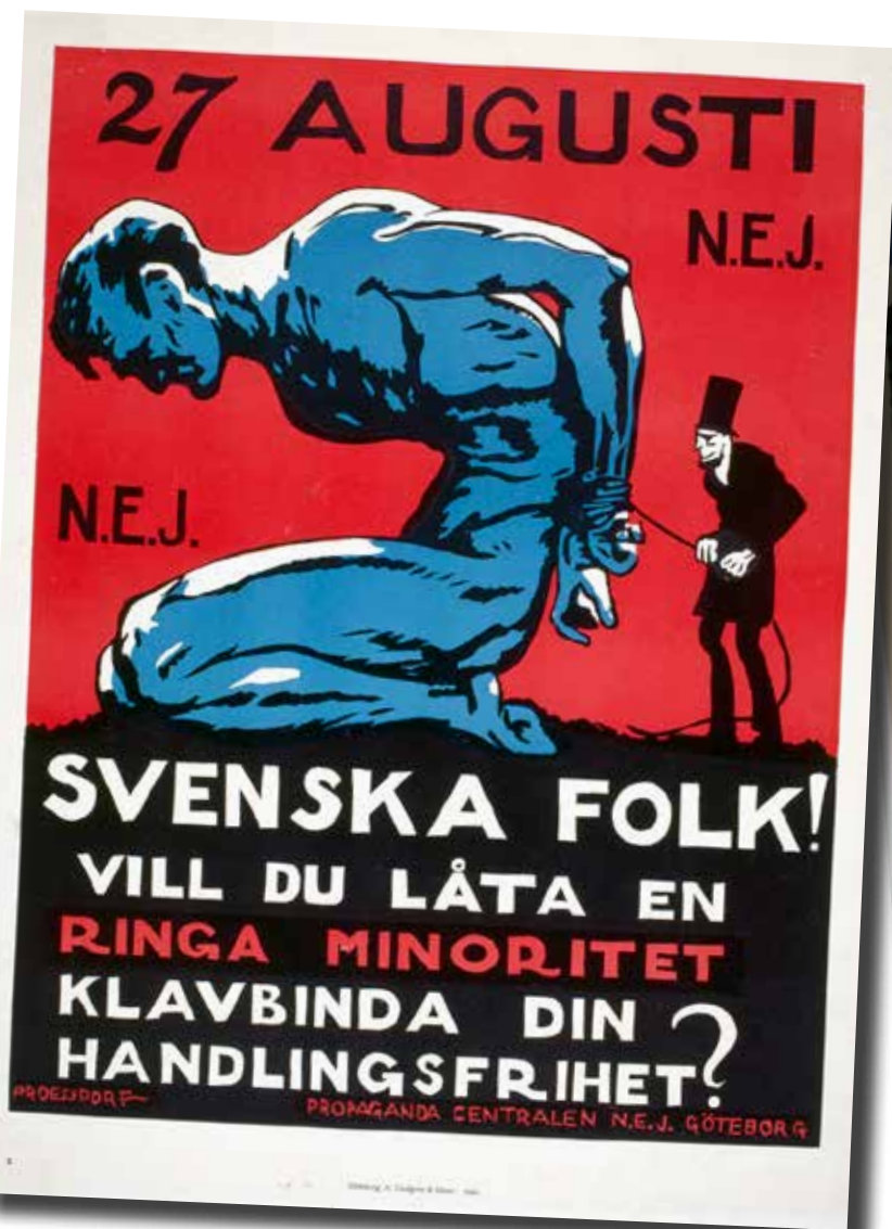
Affisch från förbudsomröstningen 1922. Från propagandacentralen för nej till spritförbud, konstnären var Fred Proessdorf.