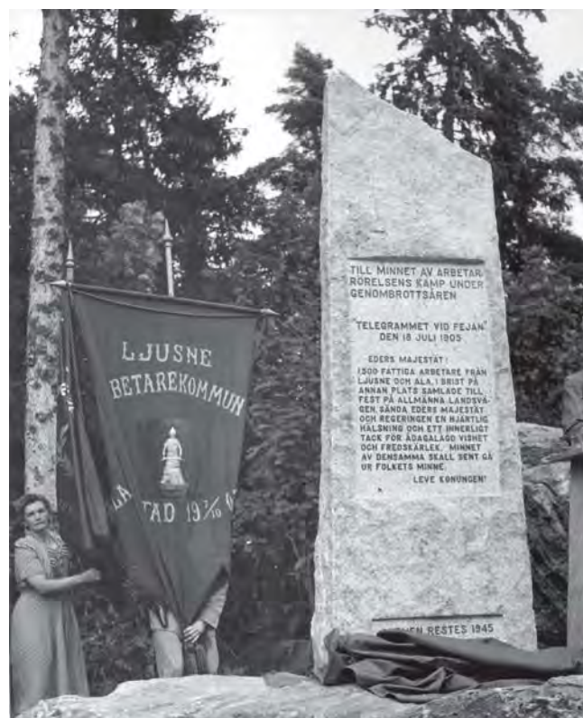
Fejanstenen, där telegrammet inristats i sin helhet, avtäcktes 1945. Den flankeras till vänster av Ljusne arbetarekommuns standar.

När Ljusne-Woxnas största arbetsplats, sågverket i Ljusne, lades ned 1907, väcktes givetvis misstanken att det rörde sig om en ytterligare bestraffning för ungdomsklubbens tilltag två år tidigare. Detta förnekades energiskt av bolagsledningen,