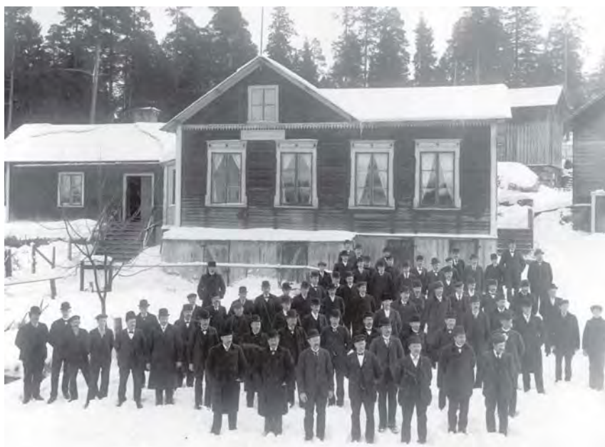
Efter stridens slut firar de 70 tidigare avskedade arbetarna sin triumf genom att låta sig fotograferas framför Bomhus Folkets hus.