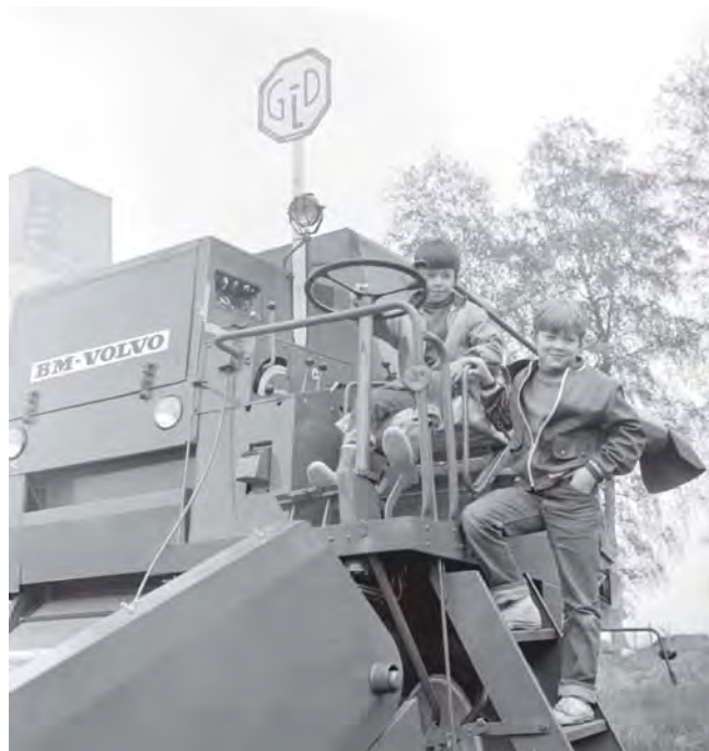
Lantbrukets Dag i Kungsgården 1970. Pojkarna verkar imponerade av den nya tekniken.

Hushållningssällskapet Dalarna Gävleborg, som man heter efter sammanslagningen 2002, är idag en renodlad medlemsorganisation, men man äger