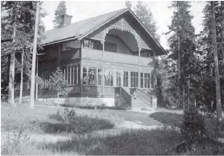
Tomtebo år 1890, stadsarkitekt E A Hedins sommarvilla.

I samband med köp av ett gammalt hus är det naturligt att söka i vissa arkiv. Kanske är det okänt för många, vilka intressanta uppgifter som gömmer sig i Hushållningssällskapets arkiv vad gäller trädgårdar. Självt har jag haft anledning att söka material om gamla trädgårdar vid tre olika tillfällen för byggnader i Villastaden och på Norrlandet, Gävle.