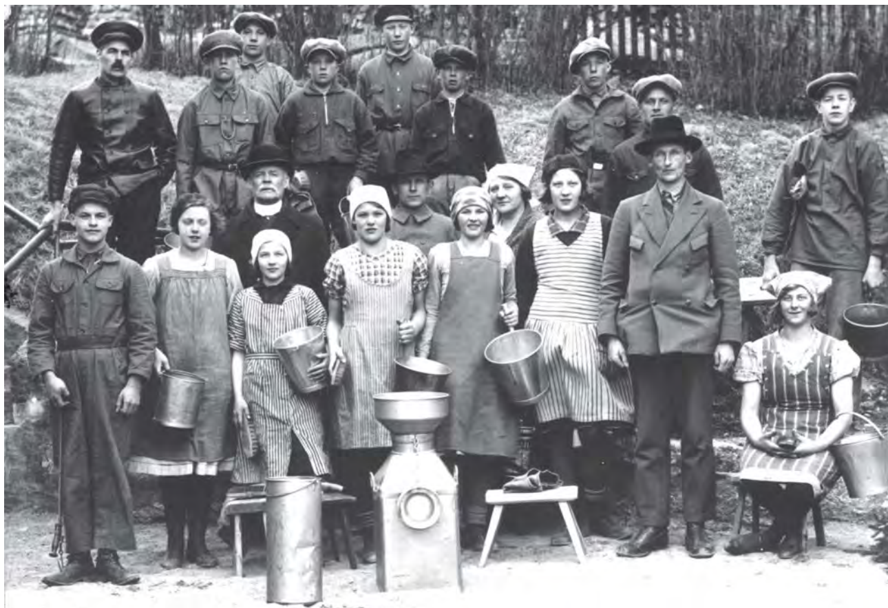
Hushållningssällskapets kursverksamhet omfattade det mesta. Här ser vi deltagarna i en mjölkkningskurs i Nordby, Järvsö 1932.