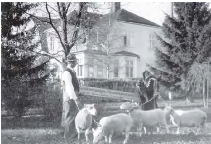
Uppvisning av cheviotfår från Gävleborgs läns fåravelstation.

Avkastningen av jordbruken var dålig, beroende på