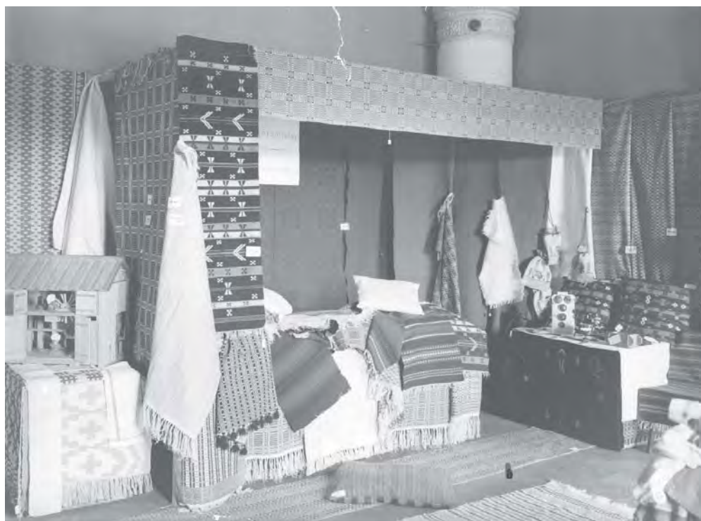
Främjandet av hemslöjd har varit ett viktigt inslag i Hushållningssällskapets verksamhet. Bilden är från Hemslöjdsutställningen i Gävle 1913.