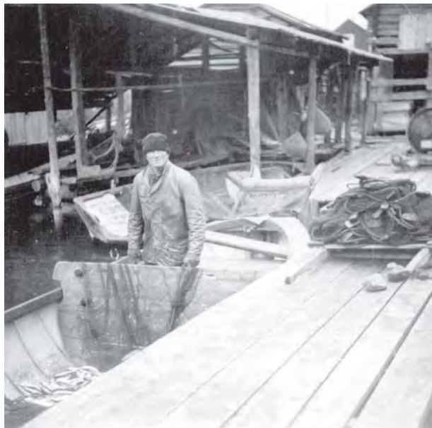
Hushållningssällskapet har genom åren arbetat med upplysande verksamhet inom fiskerieringen.

Hushållningssällskapets handlingar kan ge mycket intressant, ingående och "matnyttig" information om fisket i äldre tid i vårt län. Då jag började mina studier i historia vid Högskolan i Gävle valdes som uppsatsämne fiskerieringen, och då i huvudsak länets strömmingsfiske. För att söka relevant källmaterial konsulterades Arkiv Gävleborg, som gav rådet att studera sällskapets handlingar, vilket visade sig vara mycket fruktbart! Dessa handlingar gav en så rikhaltig information att jag kunde ägna samtliga kommande uppsatser åt fiskerieringen, sedd utifrån olika perspektiv.