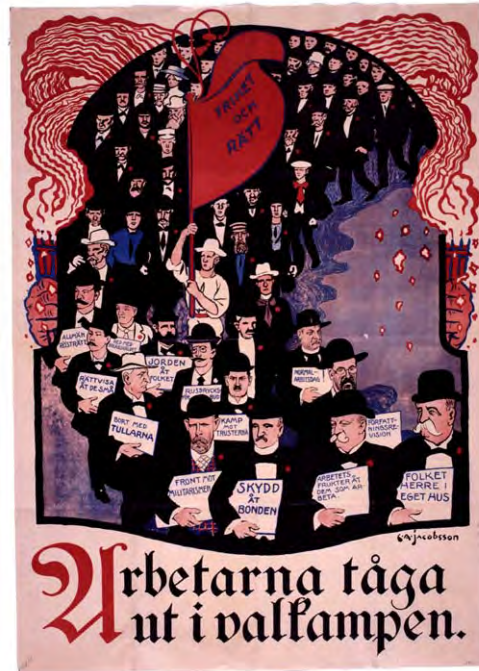
Socialdemokraterna låter arbetarna tåga till val 1911, skapad av C A Jacobsson, JAC.

Några av de mer klassiska affischerna tecknades av C A Jacobsson eller signaturen JAC. 1911 presenterade han två korresponderande verk, Arbetarna tågar ut i valkampen och Högern tågar ut i valkampen . Även om partibeteckningen saknas behöver man inte sväva i okunskap om i vilket läger de hör hemma – uppdragsgivare var det socialdemokratiska partiet. Affischerna är tecknade med humor och med glimten i ögat. I leden marscherar konservatismens och socialismens kända företrä-