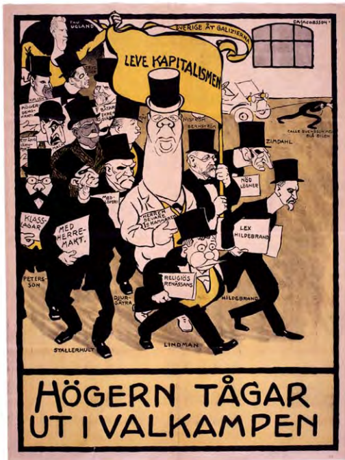
Högerens män tågar ut i valkampen 1911, skapad av C A Jacobsson.

De äldsta valaffischerna var tyngda av långa textmassor och nästan helt i avsaknad av bilder men ganska snart kom detta att förändras.