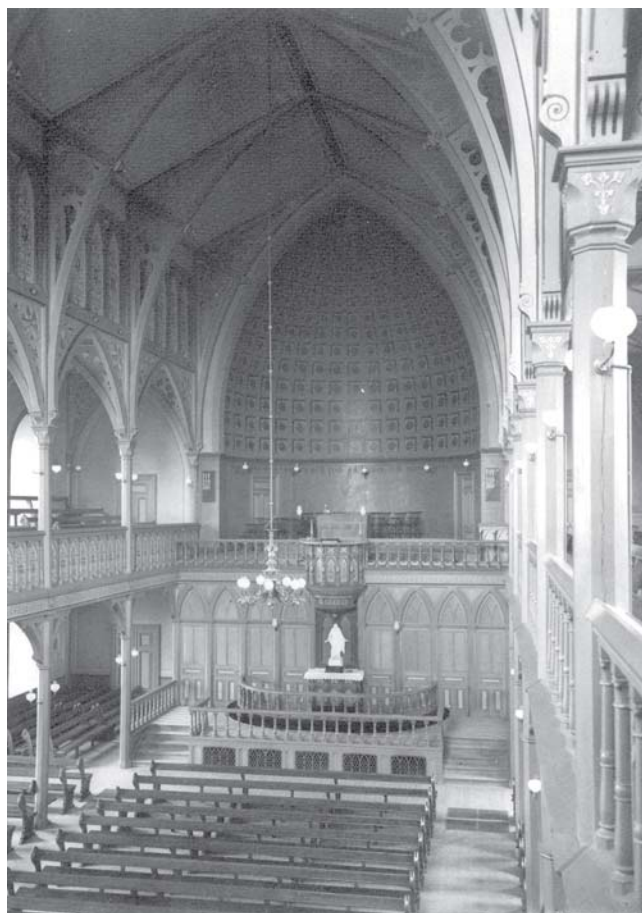
Sjömanskyrkan i Gävle stod klar 1890. Idag är den ombyggd och rymmer andra verksamheter.

Betlehemskyrkan kan ses som en manifestation av en framgångsrik församling och med framgångsrika medlemmar. Till församlingen hörde flera nyinflyttade affärsmän, fabrikörer och andra fria fö-