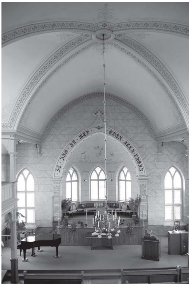
450 personer får plats i den drygt sekelgammala kyrkan. Nu ryms gudstjänstbesökarna på en enda bänk. Men snart tar pingstförsamlingen över och ger kyrkan nytt liv.

golvet. Under locket finns ett kar som kan fyllas med vatten, uppvärmt av en kamin.