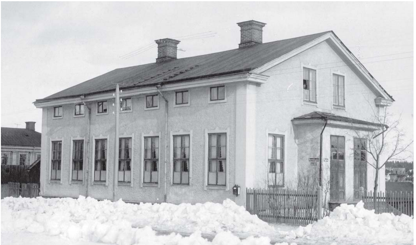
Det första Elimkapellet i Söderhamn stod klart 1878. Det byggdes ihop med den nuvarande kyrkan 1903.