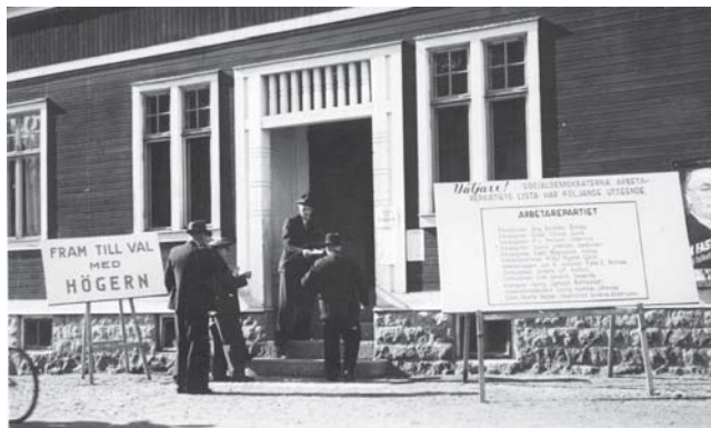
Ordenshuset i Strömsbro, här under riksdagsvalet 1940.

Av de 1 265 röster som lades i valurnorna i Strömsbro hade 942 gått till socialdemokraterna. Det var en enorm framgång för Strömsbro socialdemokratiske ungdomsklubb, som ensam hade skött valagitationen i sitt område. Till sin hjälp hade man ett bidrag på 32 kronor från Gävle socialdemokratiske arbetarekommun och ”en intensitet och kamplusta, som saknar motstycke i platsens historia” som Arbetarbladet uttryckte det. Ungklubbisterna översvämmade trakten med sitt budskap, klistrade affischer på husfasader och anslagstavlor, skickade ut valmaterial, arrangerade cykelpatruller och gjorde till och med hembesök för att vinna väljare över en kopp kaffe.