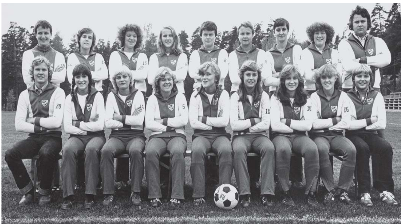
Fotboll senare. 1972 tog IFK Bergvik upp fotboll för damer på programmet. 1978 blev man distriktsmästare.