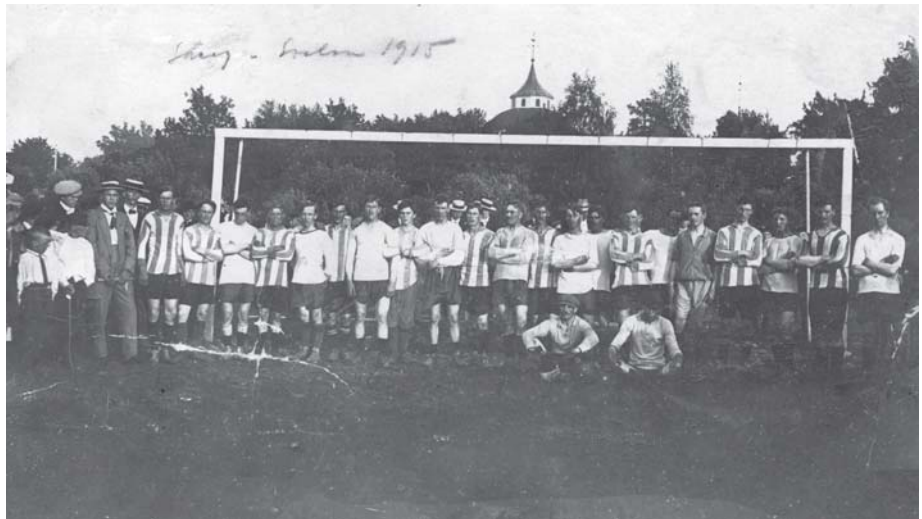
Fotboll förr. Idrottsföreningen Svalan bildades någon gång före 1906. Här står gänget uppställda inför fotbollsmatch mot Skärgårdens IF 1915.

Idrottslivet i Söderhamn med omnejd är mycket väl representerat på Folk rörelsearkivet. I medlemskåren finns Marma IF, Söderhamns segelsällskap, Sandarne sport- och idrottsförening, Söderhamns IF och många fler. IFK Bergvik är det senaste tillskottet. Deras arkiv har nu förtecknats av Gun-Britt Aaltonen.