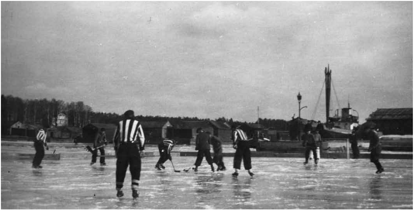
Första ishockeymatchen på Hälsingsk mark (eller vatten) i Stugsunds hamn 6 mars 1938. Stugsunds IK i randiga tröjor möter Söderhamns IF. Bilden ur Stugsunds IKs arkiv.