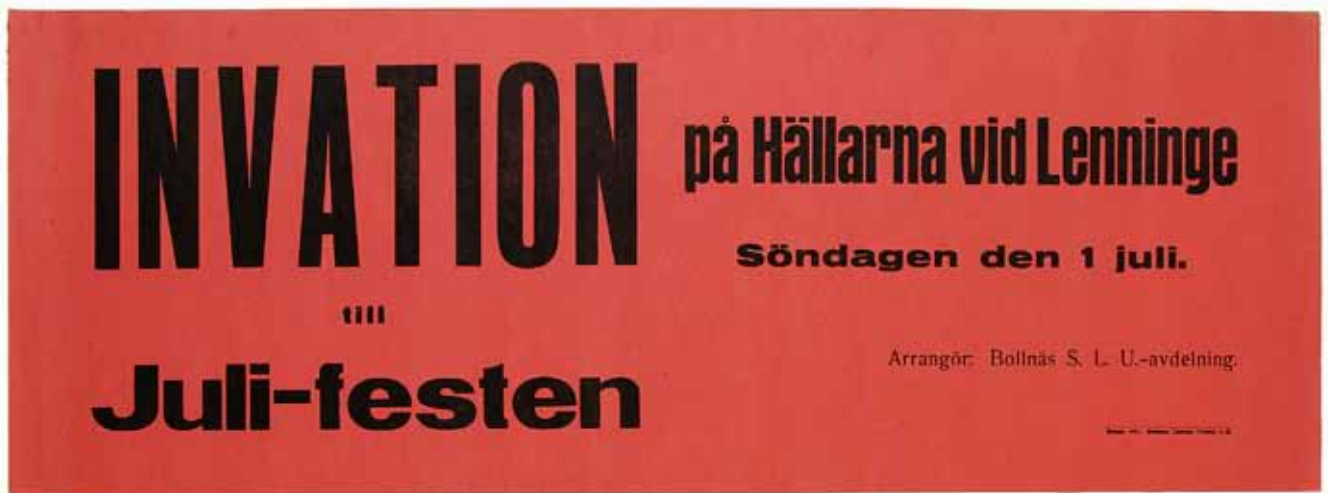
Felstavat och med stor entusiasm affischerade Svenska landsbygdens ungdomsavdelning i Bollnäs om Juli-festen 1945 i Lenninge.