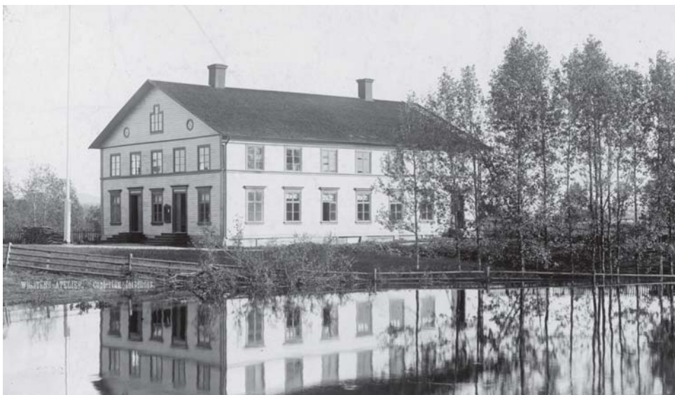
125-årsjubilerande Bollnäs Missionsförsamling byggde missionshuset i Bro under åren 1880 - 1881. Vid invigningen talade missionsförbundets grundare P P Waldenström.

Gästriklands orienteringsförbund Gästriklands skolidrottsförbund Jädraås PRO Norrala pensionärsförening