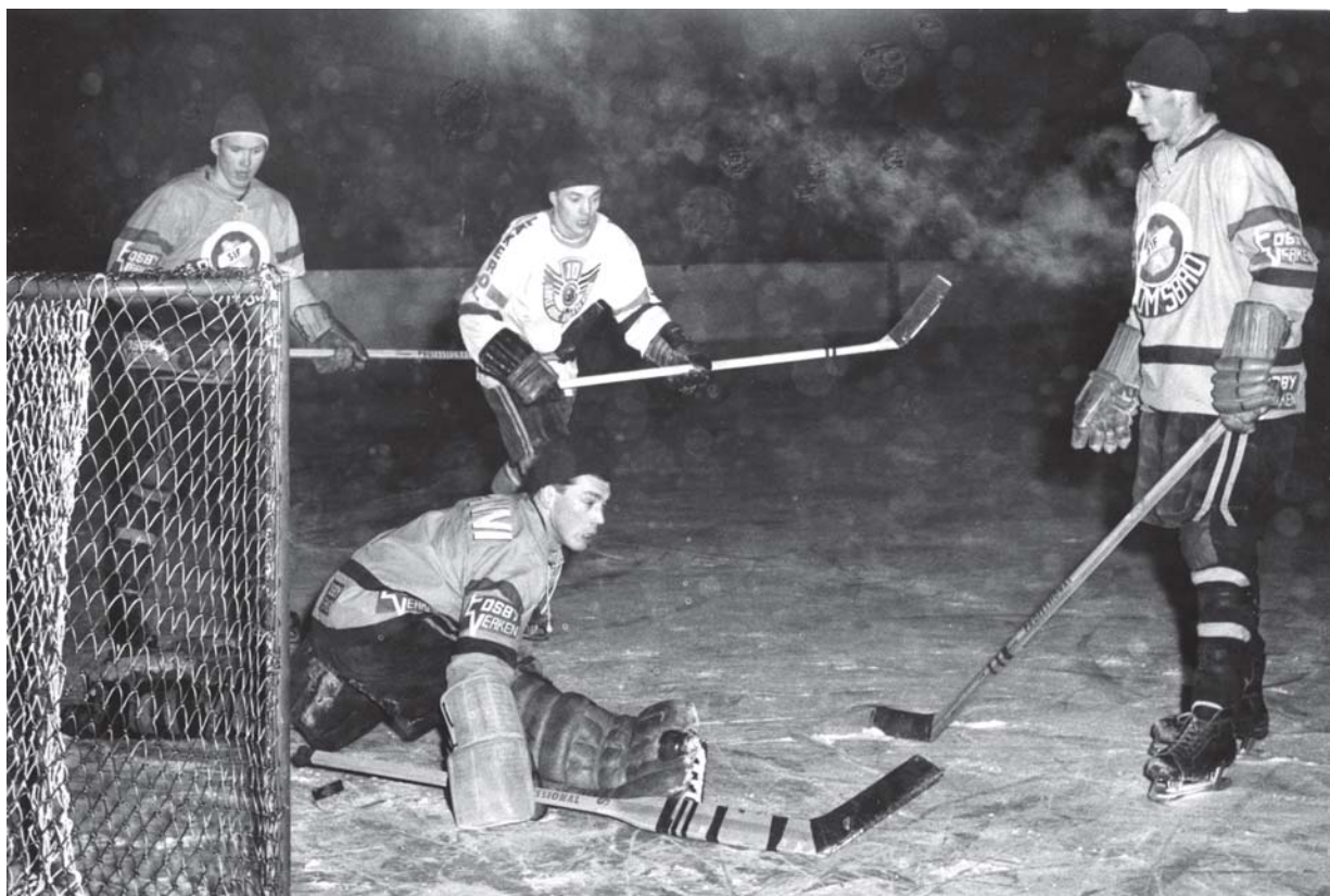
"Årets värsta ruffmatch" blev omdömet efter att GGIK besegrat Strömsbro IF med 7 - 1 i Division 1 Norra. Året var 1960.